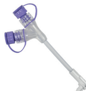
Vinklad kopplings slang med medicinport