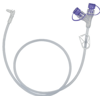
Vinklad kopplings slang med medicinport