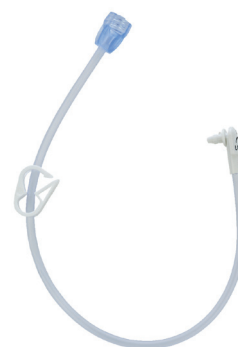
Vinklad kopplings slang utan medicinport